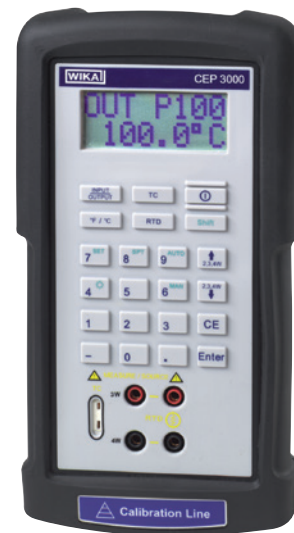
Calibrateur de température portable type CEP3000